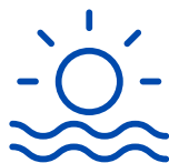
Cerca de la playa